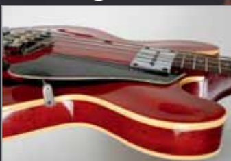
Gibson EB-2C 1968